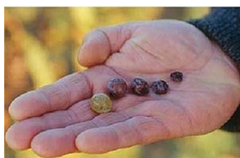
Evolution des grains de raisin : Grain jaune, pourri plein, botrytisé et rôties