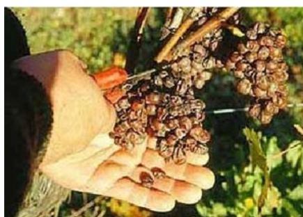
Grappes rôties par un Botrytis bien sec