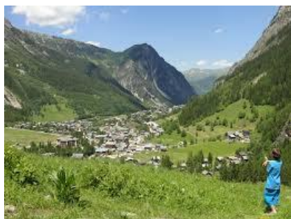
Votre station durant une semaine !