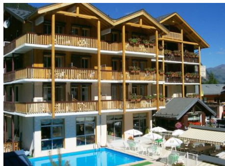
Hôtel du Grand Bec en été...

STAGE COMBINE A PRALOGNAN LA VANOISE - 2021