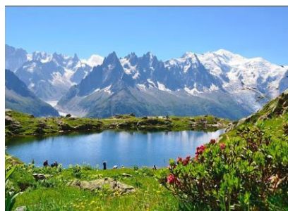
Venez découvrir un parc naturel de toute beauté !