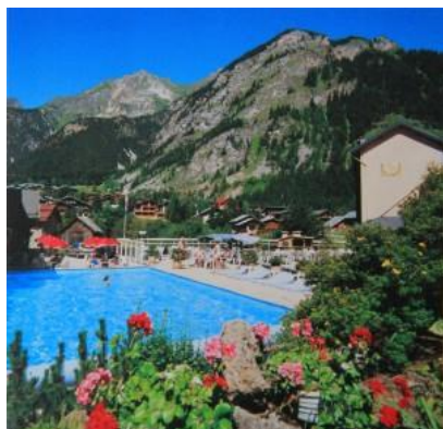
La piscine de l'hôtel et sa vue...

STAGE COMBINE A PRALOGNAN LA VANOISE - 2021