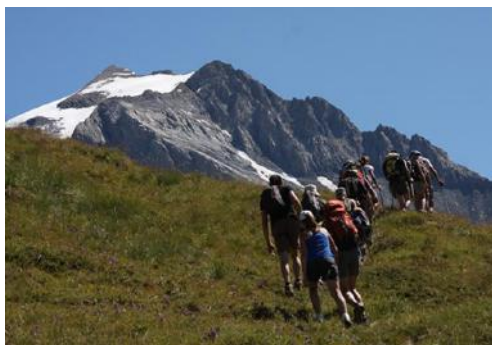
Un espace privilégié pour une balade et même une randonnée...